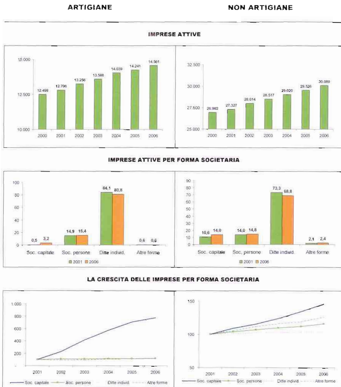
Grafico 3.3 - Le imprese ARTIGIANE e NON ARTIGIANE attive a Sassari nel periodo 2000-2006

Fonte: elaborazioni CNA SARDA su dati Movimprese