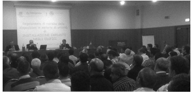
Un momento del Convegno dello scorso maggio sul decreto 37

Più selettivi anche i requisiti di qualificazione professionale per gli impiantisti che ora dovranno avere un diploma di laurea nella materia tecnica specifica. Per chi ha un