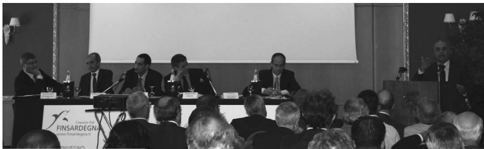
Un momento del convegno