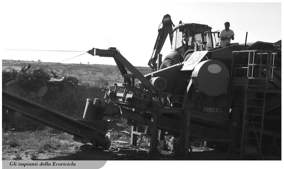
Gli impianti della Ecoricicla