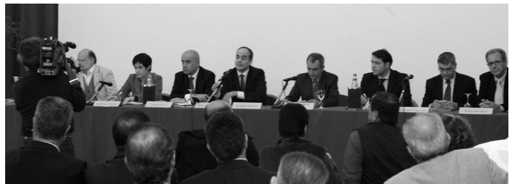
Relatori durante il convegno

queste imprese complica non poco il cambio generazionale che diventa fattore decisivo per la sopravvivenza delle stesse. Dall'indagine condotta su un campione di 552 imprese