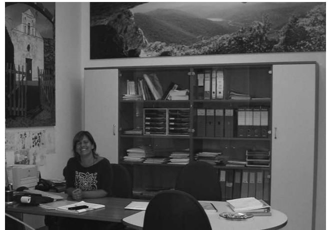
Finsardegna, agenzia di Tortolì

La modifica delle convenzioni con le banche rappresenta un altro aspetto essenziale per i confidi vigilati, da realizzare possibilmente prima della richiesta di iscrizione. Non ha senso, da un punto di vista