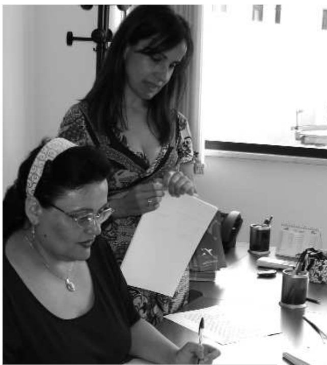
Finsardegna, agenzia di Quartu Sant'Elena