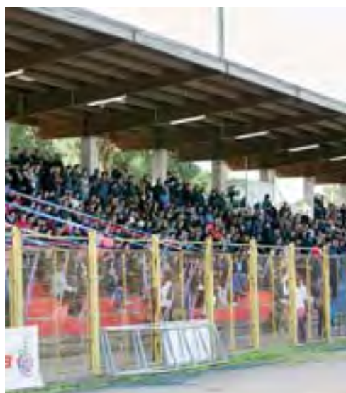
Gli spalti gremiti durante il derby di sabato [E.L.]