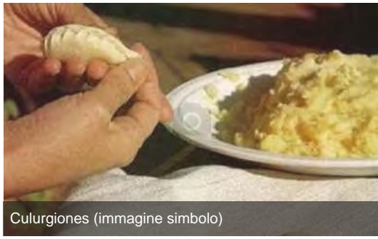
Culurgiones (immagine simbolo)

Coldiretti: Tutti gli ogliastrini devono insorgere all'introduzione delle fecole di patate nella ricetta del Culurgionis Igp", è la presa di posizione della Codiretti.