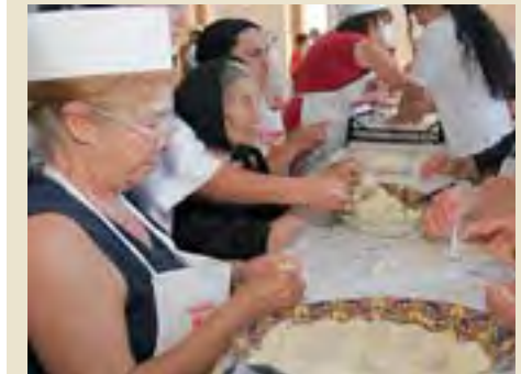
Preparazione dei culurgionis

Botta e risposta tra Coldiretti e Comitato per il riconoscimento del marchio Igp ai culuriognis. Il giorno dopo la nota dell'associazione di categoria che invita a non inserire i fiocchi di patate importati da Germania e Olanda nel disciplinare del prodotto, il Comitato rilancia. «Il fatto che non ci sia indicazione sulle materie prime non impedisce di impiegare ingredienti sardi. Ne è prova il fatto che tra le imprese aderenti ci siano anche aziende agricole del primario (formaggi, patate e grano) e che facciamo parte del Comitato allo scopo di fornire materia prima e rendere la filiera più corta possibile».