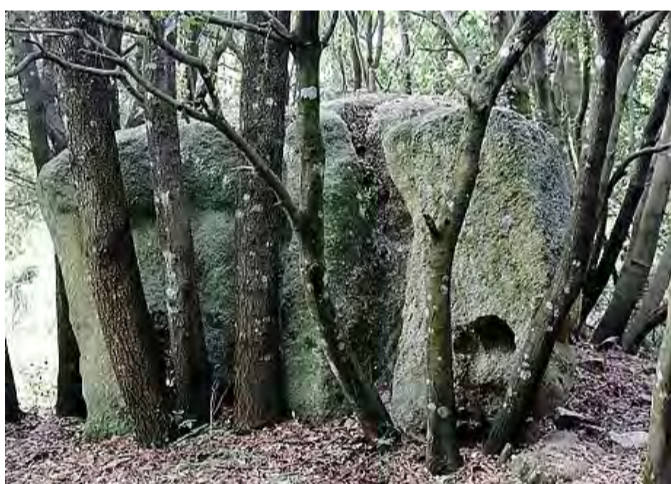
Uno scorcio del Monte. In alto il monte Pala

Il comitato, nel chiedere aiuto al Comune, ha stilato una li-