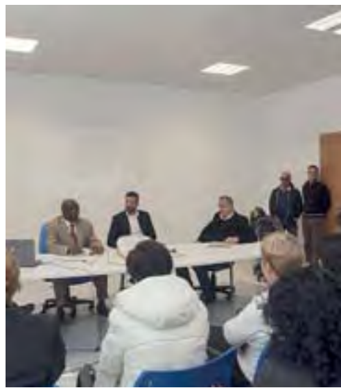
L'incontro con il ministro [ELISABETTA LOI]