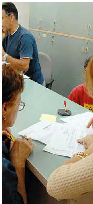
Proteste per bollette troppo care

La società: «Trovate soluzioni positive nel 79 per cento delle richieste di conciliazione»