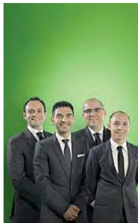
I soci dell'azienda cagliaritano Tholos