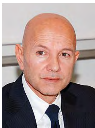
L'assessore al Turismo Crisponi

ad a ritirare la campagna pubblicitaria e «qualche benevola "punizione", a degustare alla prima occasione un buon pecorino sardo accompagnato da un bicchiere di Cannonau». Immediata la replica del Consorzio: «La questione sta nei termini contrari rispetto a quanto viene affermato dalla Regione. La campagna "Grana Padano tutta un'altra storia", è stata on air per tutto il 2012, quindi ben prima del febbraio 2013, quando è stata presentata la campagna della Sardegna e che peraltro era stata notata dal Consorzio ma senza nessuna reazione negativa».