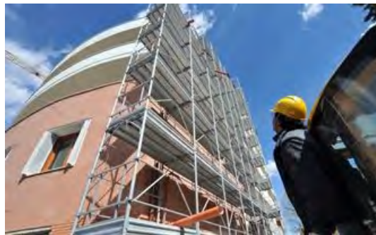
IMPRESE E MERCATO BLOCCATO IN SARDEGNA

Soltanto nei primi cinque mesi del 2013, sono state ben 124 le imprese che hanno portato i libri in tribunale, sette in più rispetto allo stesso periodo del 2012.