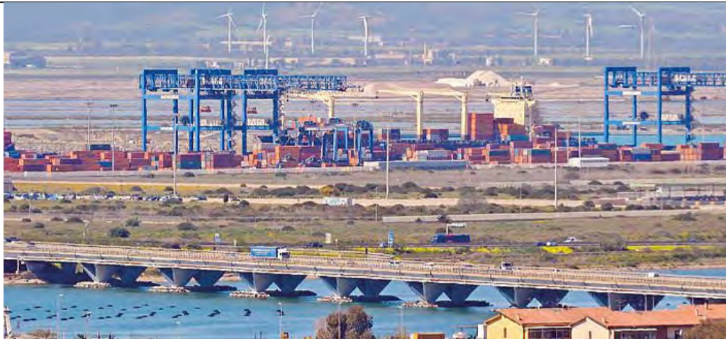
Il porto canale di Cagliari

LA RIDUZIONE DELLE TASSE DI ANCORAGGIO DECISA DALL'AUTHORITY