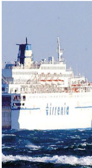
Traghetto di Cin Tirrenia