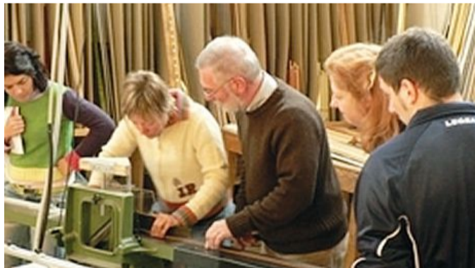
Artigiani al lavoro in un laboratorio

«Da questi dati si evince come le risorse comunitarie non siano state utilizzate appieno - hanno