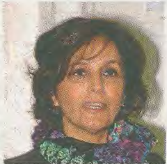
L'assessore Maria Grazia Piras

Un forum per avvicinare l'isola al nord Africa e ai paesi del Golfo. L'obiettivo è creare nuove opportunità per le imprese sarde. Il forum è stato organizzato questa mattina dalla Cittadella dei musei dall'università di Cagliari e dall'Unicredit. Per l'assessore regionale all'Industria, Maria Grazia Piras «l'internazionalizzazione delle imprese isolate è uno dei cardini del programma di sviluppo 2014-2019. I percorsi di sviluppo internazionale non possono essere affidati all'improvvisazione. In particolare per le imprese di minori dimensioni. In Sardegna il livello di competi-